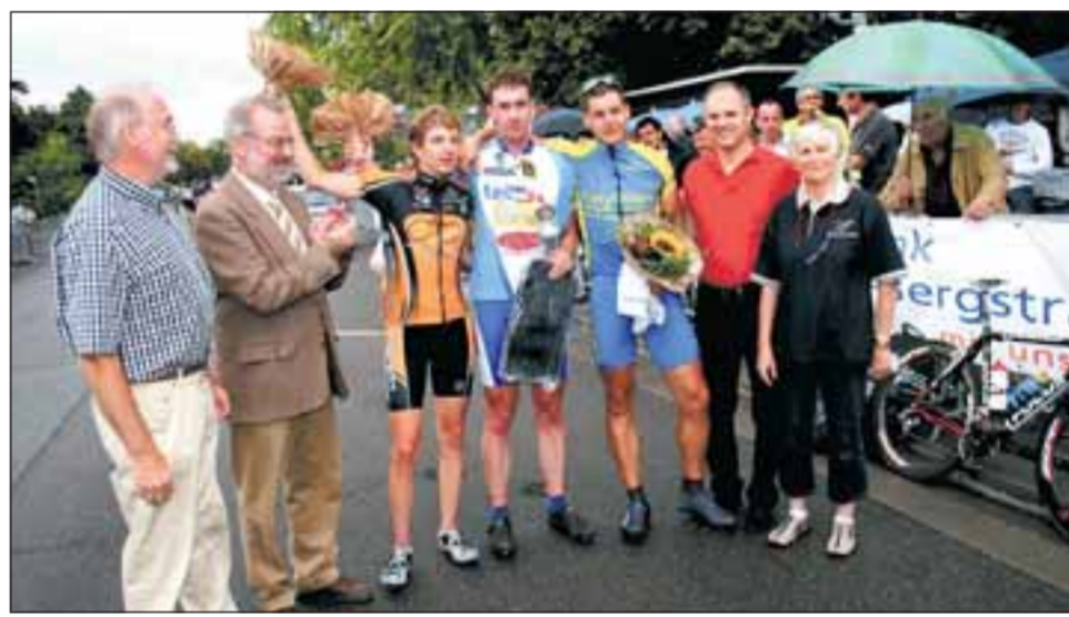
Das Siegertrio des C-Klassenrennens erhielt von der örtlichen Prominenz Applaus.