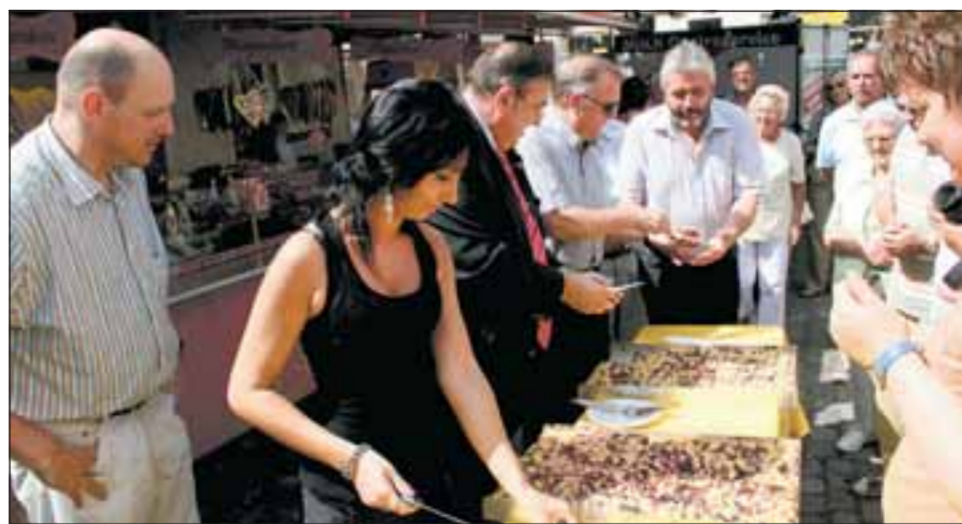
Zum Auftakt wurde der Kerwe-Kuchen angeschnitten und verteilt.

Spezielle Kerweangebote hatten die Gaststätten „Zum Ochsen“, „Zur Sackpfeife“ und der „Würzburger Hof“ auf ihrer Speisekarte stehen. Im mittelalterlichen Hofgarten von Ulrike Söhn fühlten sich die Christdemokraten wohl, die seit dem letzten Jahr die Kerwe durch ein Kulturprogramm beleben. Klaus Kolb, der Mundartdichter und Kulturbeauftragte aus den eigenen Reihen, verstand es wie-