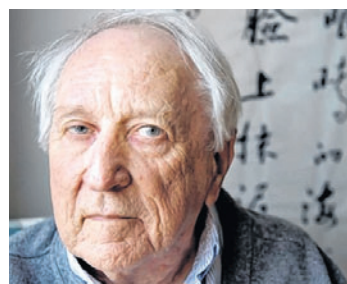
Erhält den begehrten Literaturpreis: Tomas Tranströmer.

STOCKHOLM. Der schwedische Lyriker Tomas Tranströmer erhält den Nobelpreis für Literatur. Er weise dem Leser „in komprimierten, erhellenden Bildern neue Wege zum Wirklichen“, begründete die Schwedische Akademie gestern ihre Entscheidung für den 80 Jahre alten Lyriker. In seiner Heimat gab es Jubel, dass der schwer kranke Tranströmer endlich den wichtigsten Literaturpreis der Welt bekommt. Er galt seit vielen Jahren als Preiswärter. In Deutschland, wo sein Name weniger bekannt ist, freute sich der Carl Hanser Verlag für seinen Autor. Sonst blieb das Echo verhalten. Der Nobelpreis ist mit umgerechnet 1,1 Millionen Euro dotiert. Er wird traditionell am 10. Dezember in Stockholm überreicht. dpa